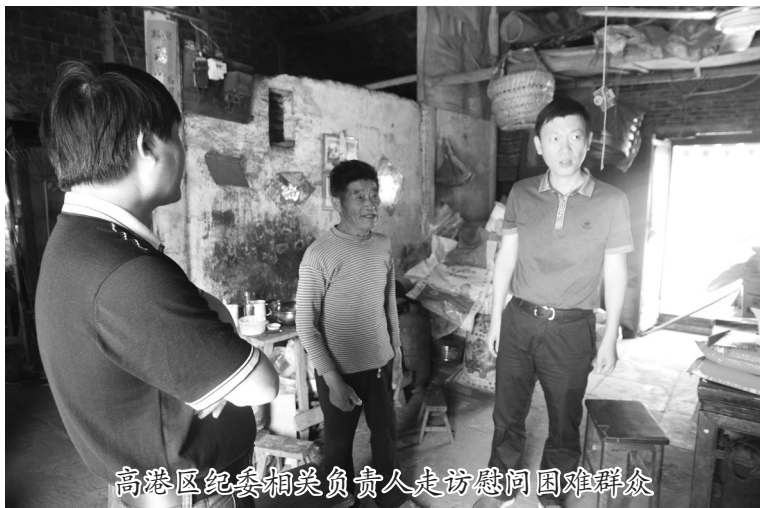
高港区纪委相关负责人走访慰问困难群众

“纪委基层行”活动,让社会救助“兜底性”功能发挥在基层、落实在基层、造福在基层,进一步拓展了民政工作透明度,推动了民政工作新发展,提高了基层群众的获得感和满意度。