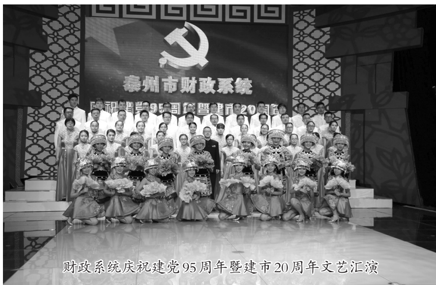
财政系统庆祝建党95周年暨建市20周年文艺汇演

处室或岗位,组织开展专项督查,将廉政风险化解在未发之时、降低到最低限度。强化监督技术支撑,推进财政“大数据”平台建设,充分发挥部门预算编制、国库集中支付、非税收入收缴、国有资产监管、政府采购管理、资金绩效评价、社会综合治税等业务系统功能,提升财政安全运行的信息化保障水平。三是建立更加科学的