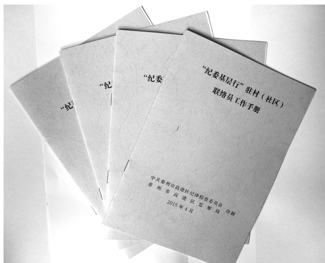
“纪委基层行”驻村(社区)联络员工作手册