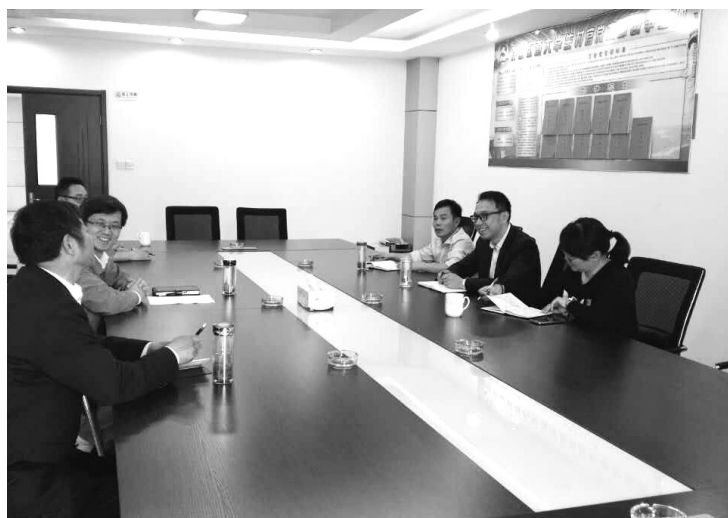
“纪委基层行”联络组走访调研许庄街道

“宰相必起于州郡,猛将必发于卒伍。”基层是“摔打”干部的最好“练兵场”。纪检干部更应该走进基层,在基层的实践锻炼中增强党性、改进作风、磨练意志、陶冶情操、提升境界、增长才干。只有通过基层这个“大熔炉”的铸炼,我们才能当好基层组织建设的“督导员”、群众诉求的“代理员”、群众纠纷的“调解员”、经济发展的“服务员”。