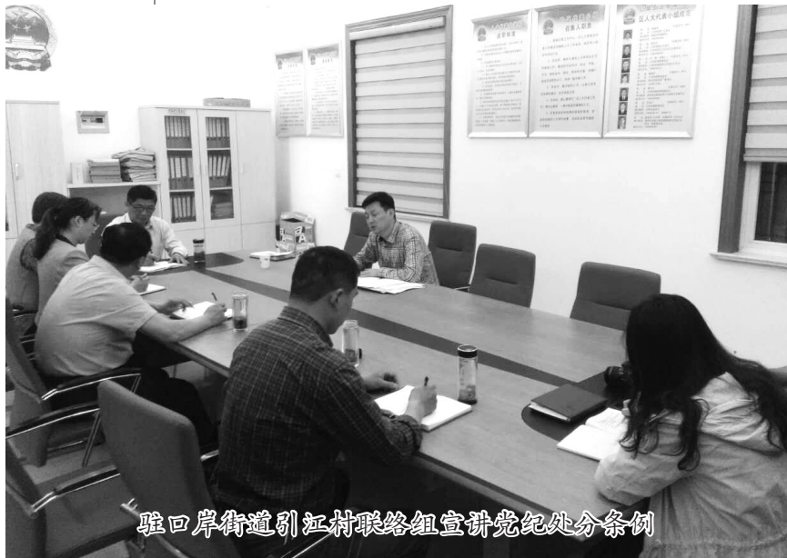
驻口岸街道引江村联络组宣讲党纪处分条例

建章立制,监督管理到位。 根据“纪委基层行”活动反馈意见要求,及时完善财务审批、审核制度,推进“非现金”结算工作力度,深化“四务”公开,强化纪律和规矩意识,在注重抓早抓小和监督管理上下功夫。同时,深刻汲取二陈村教训,举一反三,在全镇积极开展环境管护资金、粮食综合补贴等涉农领域问题专项整治活动,追缴资金4万余元。