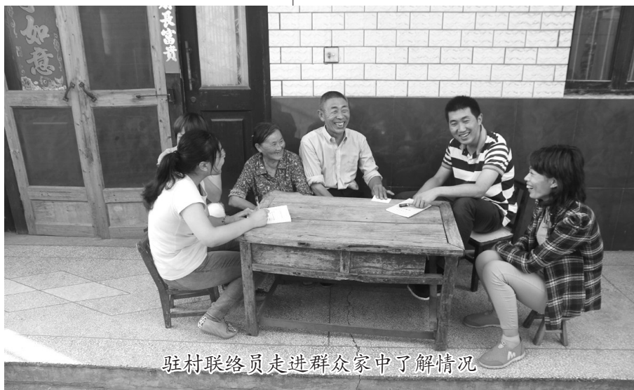
驻村联络员走进群众家中了解情况