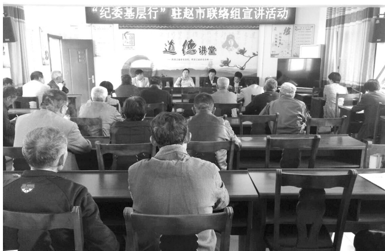
“纪委基层行”驻胡庄赵市村联络组开展宣讲活动

三省吾身争做“新铁军”。 新形势下的纪检监察工作，对自身的能力素质提出了新要求。“纪委基层行”是区纪委的一项创新举措，更是全体纪检监察干部能力素质的一次“试金石”。我在驻村联络中学习，在学习中工作，一日三省吾身，严格遵守政治纪律和政治规矩，保持优良作风，认认真真锤炼自己，不断提升感悟力、领悟力、执行力，争当高港尊严的坚定守护者、有力促进者、积极引领者。