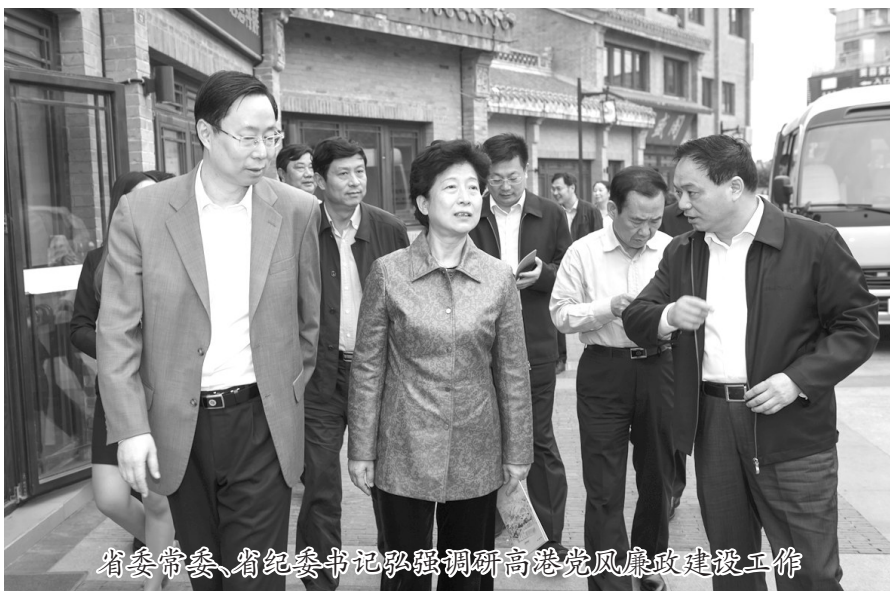
省委常委、省纪委书记弘强调研高港党风廉政建设工作

为了确保专项巡查组织有方、执行有力,高港区纪委抽调委局机关、园区、镇(街道)及区级机关部门(单位)纪检干部、村(社区)纪检委员、各部门(单位)纪检监察后备干部组建了5个巡查组,每组8-12人。各巡查组明确一名区纪委领导带队,另配备1名财务专门人才参与巡查。同时,专门制定下发了《高港区纪委巡查工作办法(试行)》,印制了《巡查工作手册》,确保巡查有章