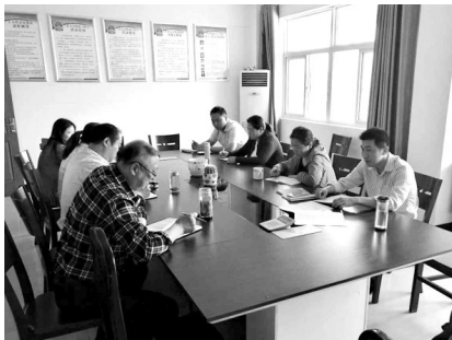
社区联络组开展廉政授课活动

一年多来,区审计局共向区纪委移送可成案问题线索6个,区镇两级纪检监察组织根据线索立案调查“蝇式村官”10多人,有效发挥了审计部门的反腐“尖兵”和“利剑”作用。