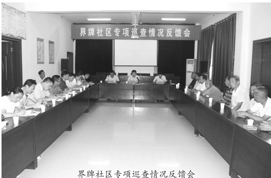
界牌社区专项巡查情况反馈会