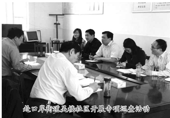
赴口岸街道吴楼社区开展专项巡查活动

用好“三种方式”。 一是专项巡查。发现违纪苗头就马上去管,触犯了纪律及时处理,准确运用“四种形态”,杜绝“大问题不敢碰、小问题不当事”的现象。坚持“一案双查”,持续跟踪了解被巡查地区和单位的整改情况,在整改环节做到“三要”,即交账要清、对账要准、销账要明,把巡查成果落到实处。二是驻村联络。驻村联络员、助理联络员主动