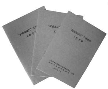
专项巡查工作手册