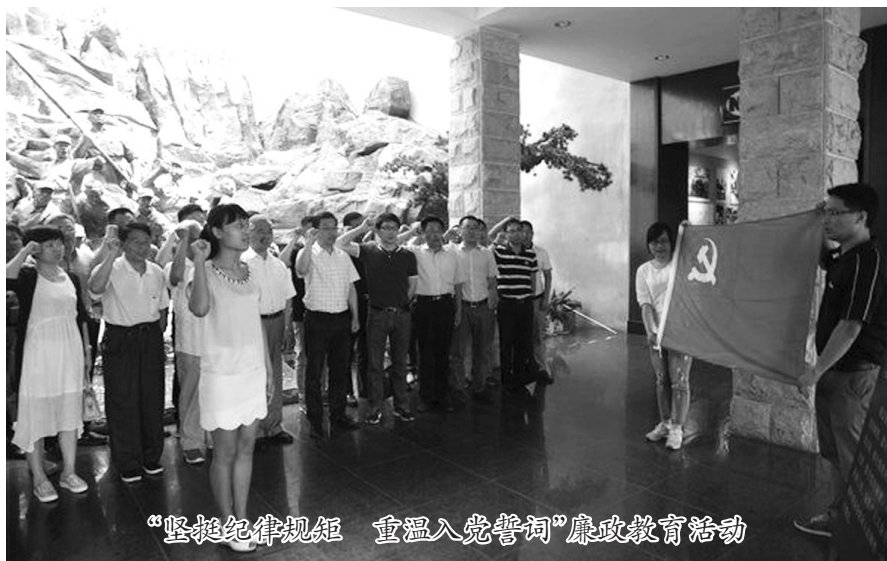
“坚挺纪律规矩 重温入党誓词”廉政教育活动

在措施落实上压实、压实、再压实。以往的从严治党工作考核指标过于笼统,看似大家都有任