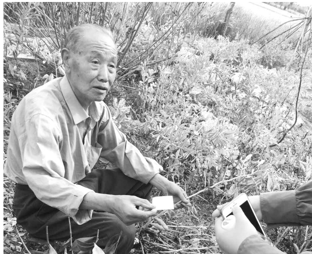
“纪委基层行”联络员向村民发放联络卡