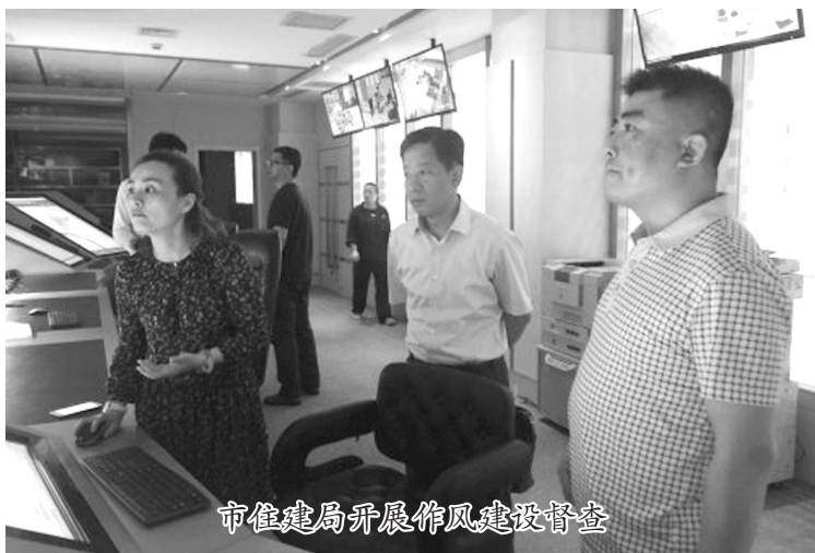
市住建局开展作风建设督查

用,安排专题警示教育,邀请市纪委纪检监察室相关负责人剖析锦园、绿源公司等违纪案件,以案说法,以案明纪。通过类似典型案例,引导住建系统党员干部适应形势,顺应潮流,自觉将党纪挺在法律前面。今年分两批组织系统内党员到市看守所进行了现场警示教育,收到了很好效果。同时,为堵塞漏洞,围绕工程建设腐败问题易发多发特点,并结合省委巡视反馈意见整改要求,出台了《关于禁止领导干部违反规定插手干预工程建设领域行为的若干规定》、《工程建设管理人员廉洁自律若干规定》等文件,进一步从制度规范上增强纪律刚性约束。