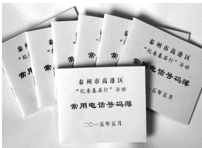
“纪委基层行”常用电话号码簿